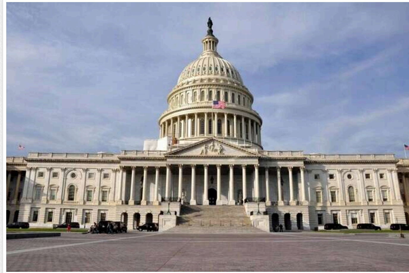
Республіканська партія отримала контроль над Сенатом: за Палату представників ще доведеться позмагатися

Республіканська партія здобула більшість у Сенаті – верхній палаті Конгресу США, отримавши контроль над ним на наступні два роки. Але республіканцям ще доведеться поборотися за Палату представників.