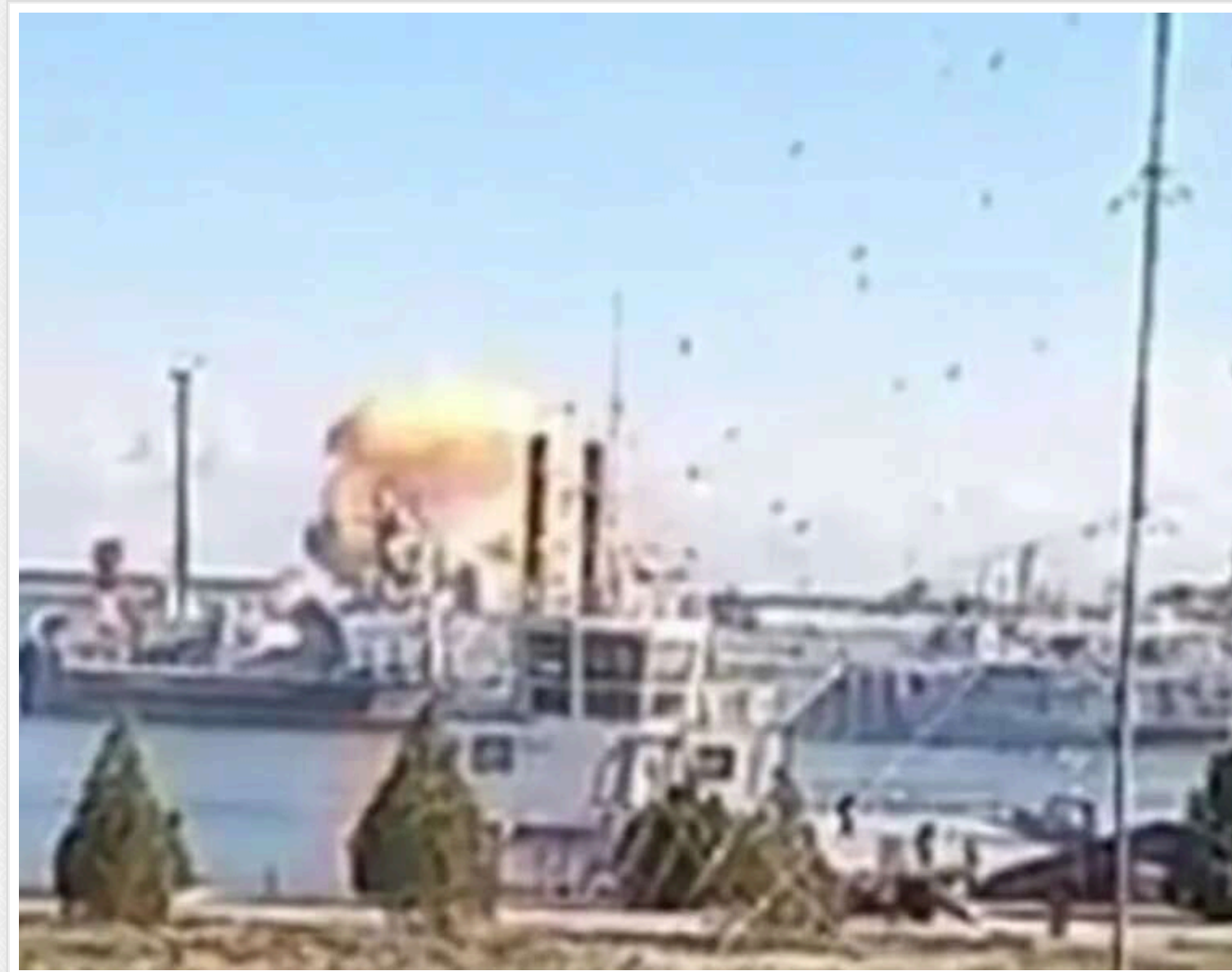
У мережі з'явилися супутникові знімки порту в Каспійську після ранкової атаки дронів ГУР

Увечері, 6 листопада, у мережі з'явилися супутникові знімки порту в Каспійську (Дагестан). Вони були зроблені після чергової ранкової атаки дронів Головного управління розвідки по російському флоту.