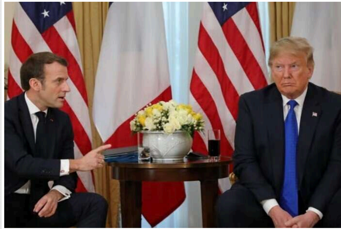
Трамп і Макрон у телефонній розмові обговорили ситуацію в Україні та на Близькому Сході

Президент Франції Еммануель Макрон і Дональд Трамп, який переміг на президентських виборах у США, під час телефонної розмови в середу заявили про своє прагнення "працювати задля відновлення миру і стабільності", передає AP з посиланням на Єлисейський палац.