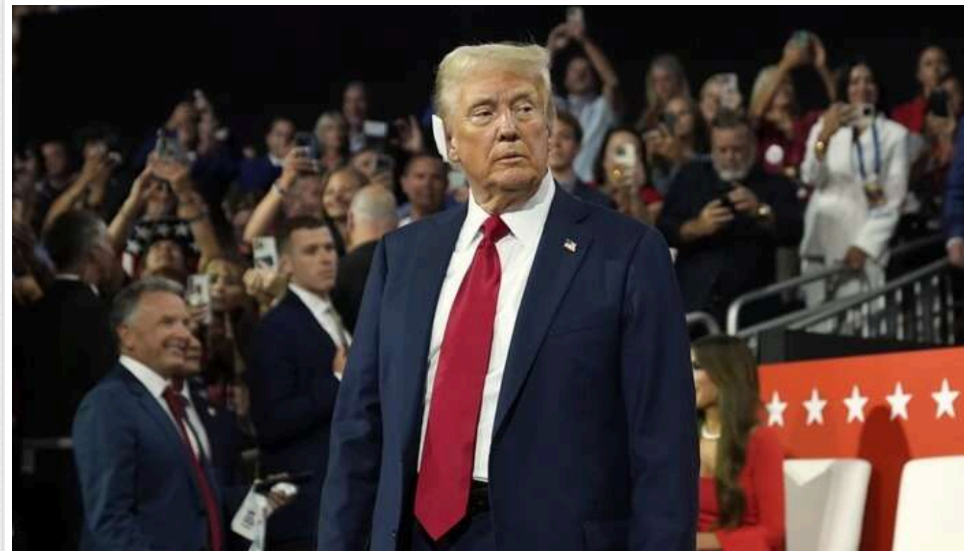
Дональд Трамп перемагає у п'ятому "хиткому" штаті: забезпечив собі 291 голос виборників

Експрезидент, кандидат від Республіканської партії Дональд Трамп здобуде перемогу у важливому штаті Мічиган.