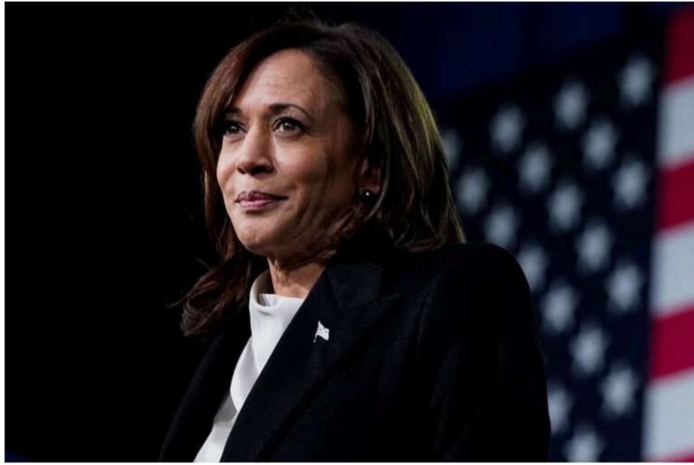
Оглядач Foreign Policy розповів, чому Гарріс програла