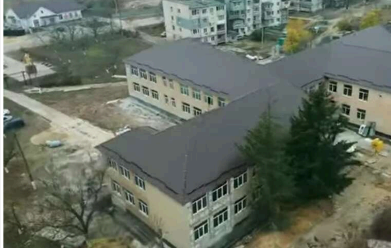
В Маяках на Одещині у школі планують зробити капремонт за 85 мільйонів за завищеними цінами

Управління містобудування, архітектури, землевпорядкування, екології, ЖКГ та комунальної власності Маяківської сільської ради Одеської області за результатами тендеру 25 жовтня замовило ТОВ «Стані магнум» капітальний ремонт школи в селі Надлиманське за 84,70 млн грн.