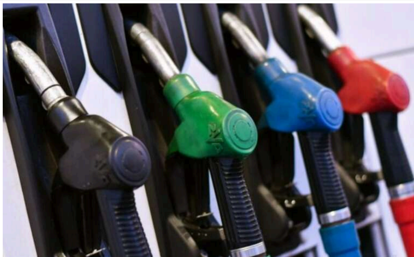
В Україні взимку закриються деякі мережі АЗС

Лютий буде особливо складним для українських мереж АЗС. У цей період значно зменшиться попит на паливо. Такий прогноз зробив експерт паливного ринку Дмитро Льюшкін.