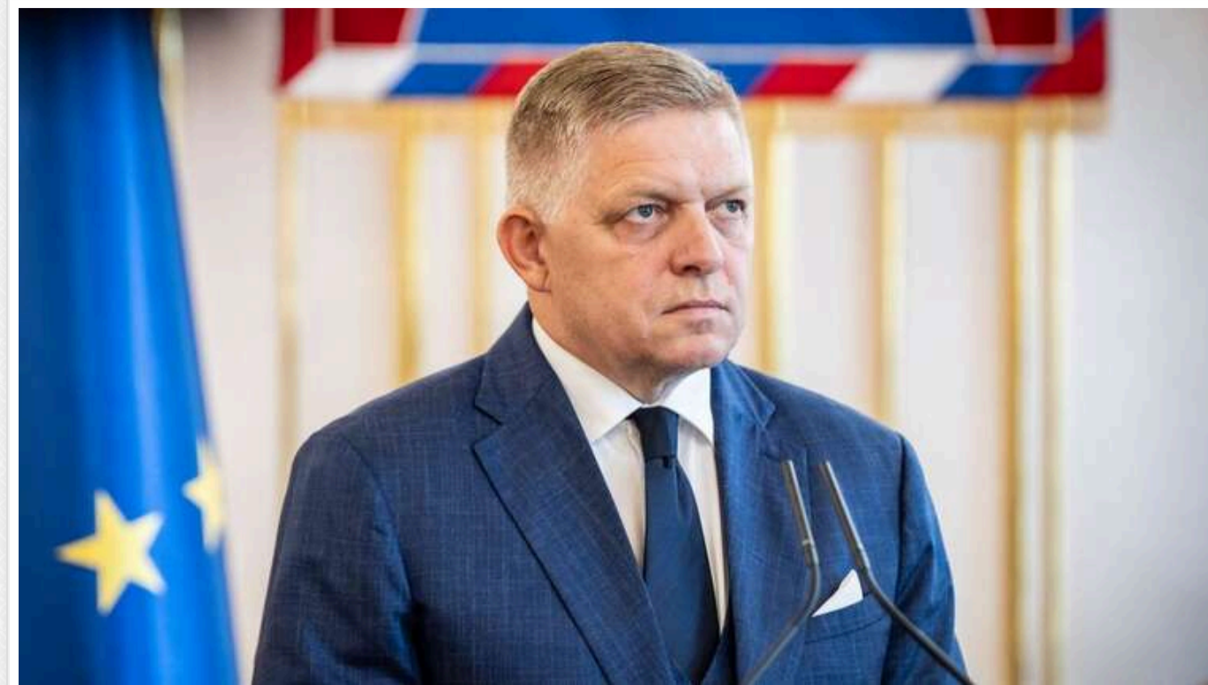
Трамп може припинити або значно скоротити допомогу Україні, - Фіцо

Про це Фіцо заявив під час пресконференції з міністром закордонних справ та європейських справ Словаччини Юраєм Бланаром.