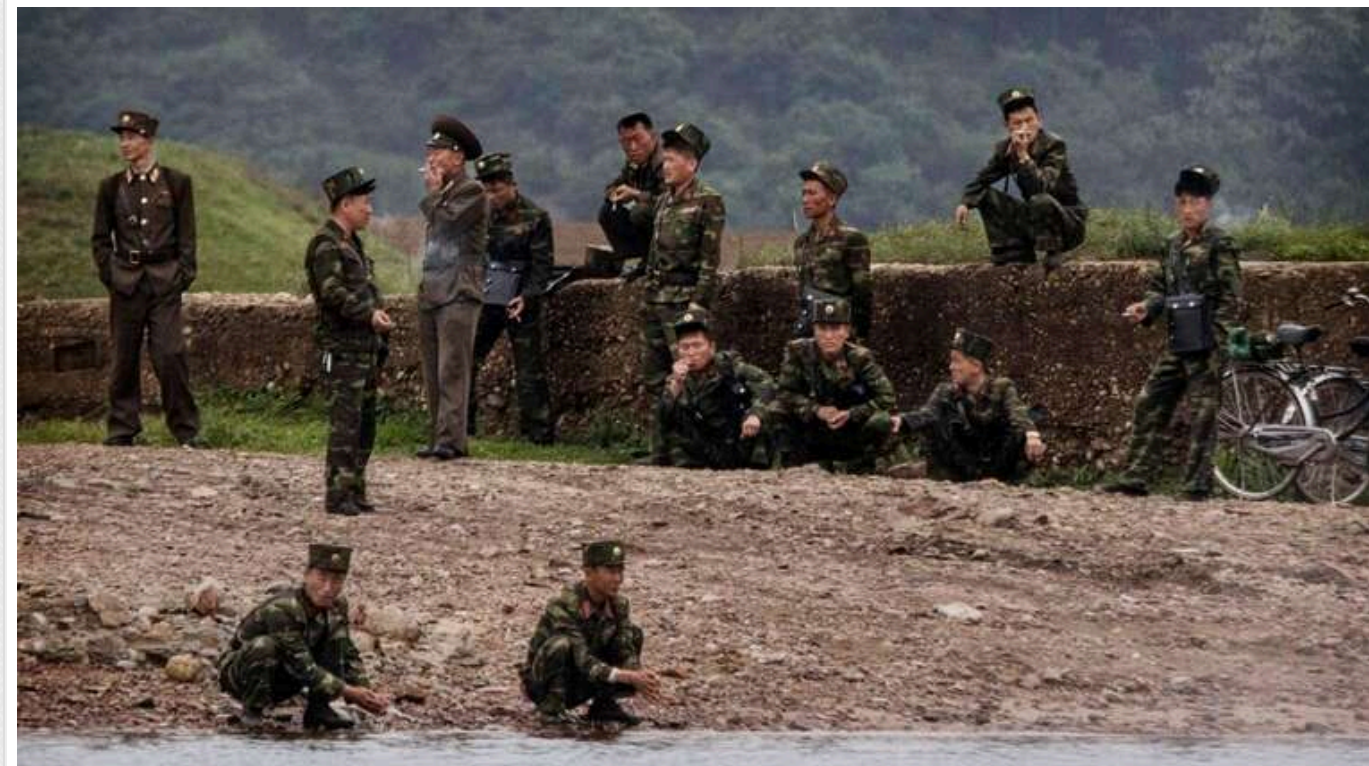
Російські пропагандисти почали запевняти росіян, що солдатів з КНДР немає в Курській області – ЗМІ

Російські пропагандистські акаунти, відомі як кремлеботи, запустили масштабну інформаційну кампанію, щоб переконати росіян у відсутності військових із Північної Кореї в Курській області. Ця активність почалася на фоні заяв про перше зіткнення українських та північнокорейських військових.