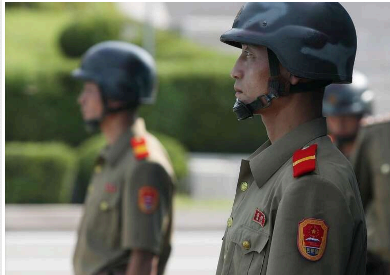
ЦПД: На Курщині росіяни навчають солдатів із КНДР застосовувати дрони

У Курській області Росії проводяться навчання військових із Північної Кореї. Російські інструктори готують солдатів та офіцерів КНДР до сучасних бойових дій.