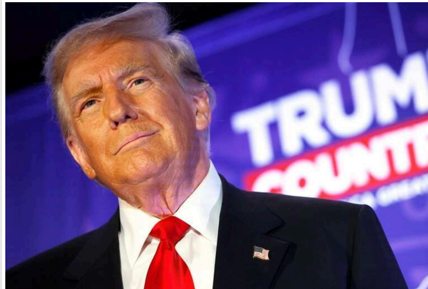
Трамп може обійти Гарріс у більшості штатів, що вагаються, - ЗМІ

Американські ЗМІ повідомляють, що за прогнозами Трамп може випередити Гарріс у більшості штатів, які вагаються.