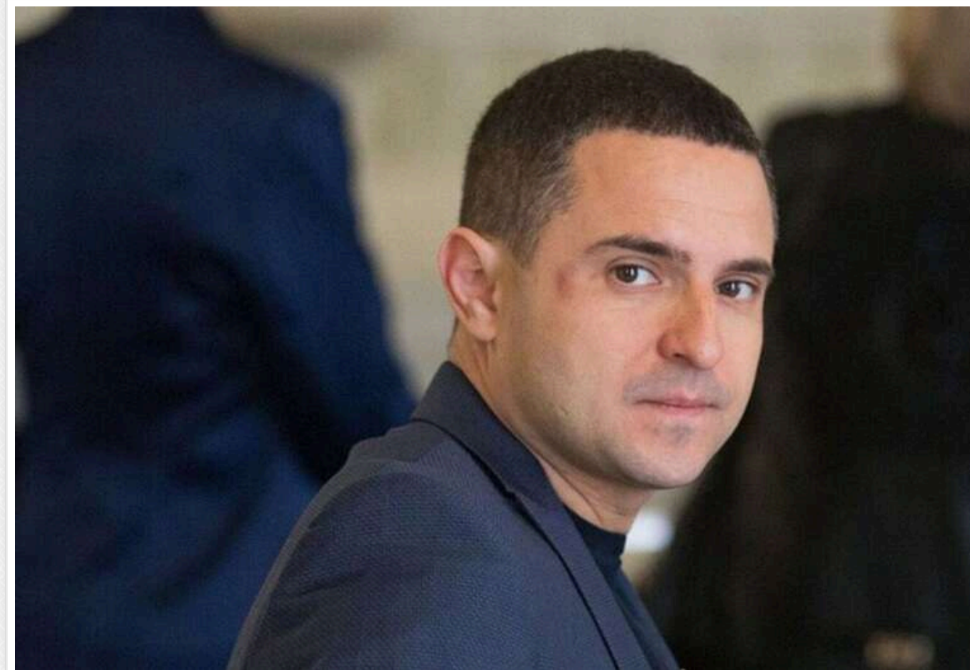
ЗМІ: Куницький втік з України через корупційну кримінальну справу

Народний депутат від «Слуги народу» Олександр Куницький міг залишити Україну через кримінальну справу, пов'язану з його корупційними діями.