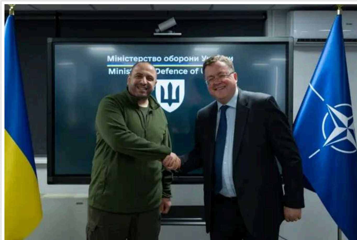
У Київ прибув очільник представництва НАТО в Україні

Керівник представництва НАТО в Україні відзначив значний прогрес у реформуванні ЗСУ.