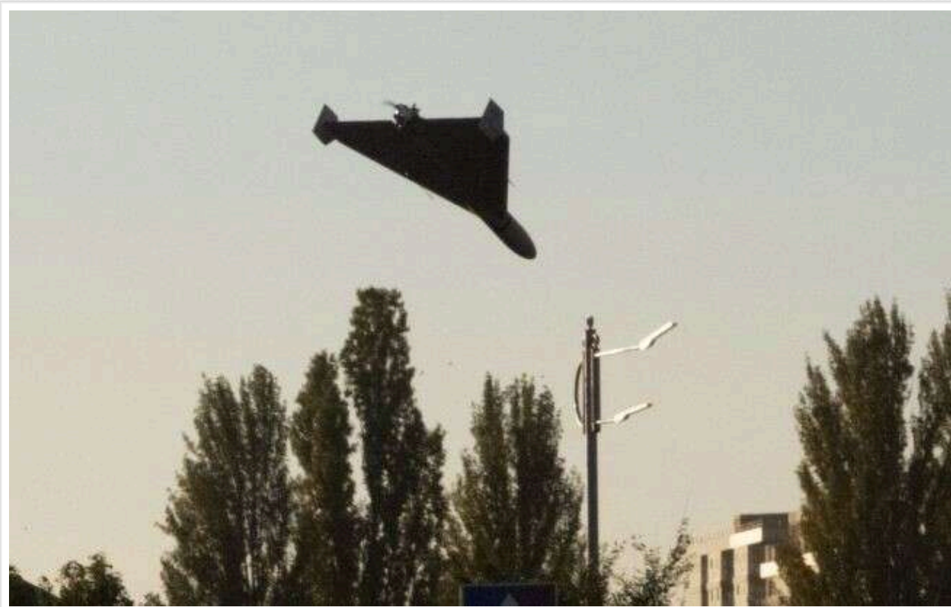
ЗС РФ запустили "шахеда" з північно-східного напрямку

Увечері вівторка, 5 листопада, російські війська знову запустили по Україні групи ударних дронів-камікадзе Shahed-136. Ворожі безпілотники проникли на нашу територію з боку Сумської області.