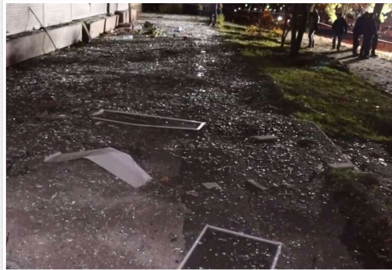
Окупанти завдали ударів по п'ятиповерхівці у Харкові: у мережі показали відео наслідків

Сьогодні, 5 листопада, російські окупанти завдали удару по Харкову. Повідомляється про наявність постраждалих.