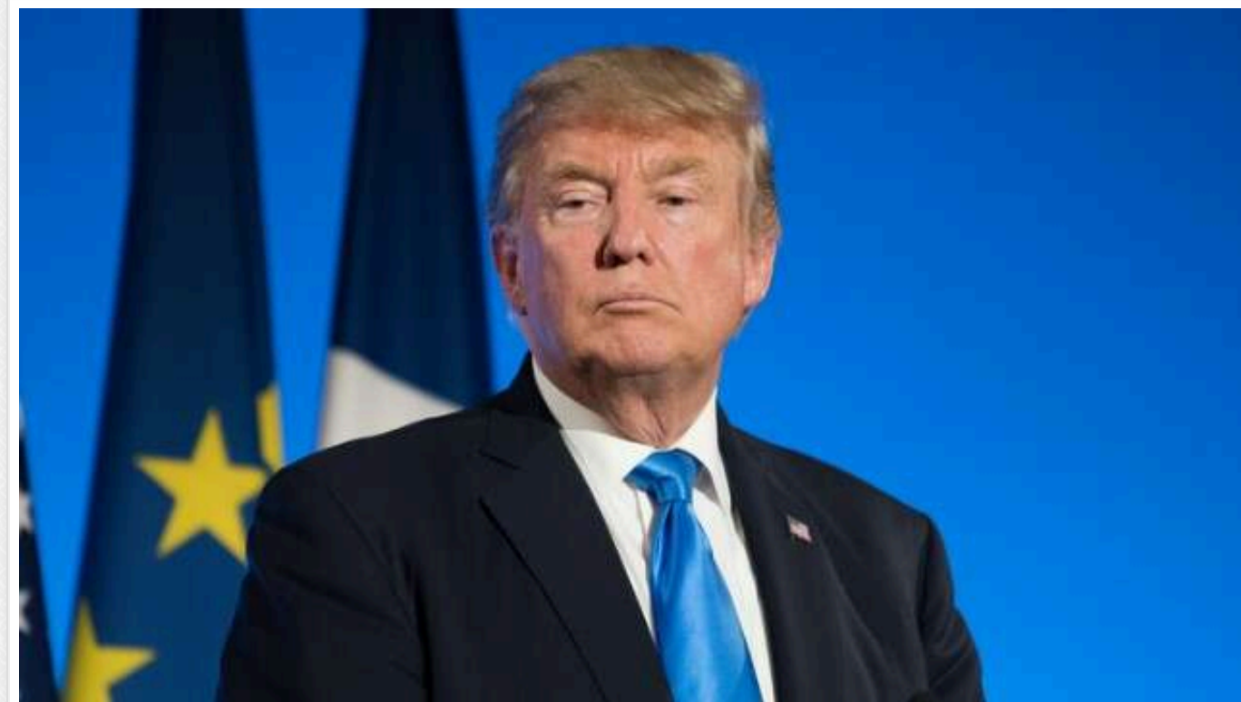
В ЄС немає згоди щодо майбутньої допомоги Україні, якщо Трамп переможе на виборах, - DW

В Європейському Союзі немає згоди щодо майбутньої допомоги Україні, якщо Трамп стане президентом і припинить фінансування Києва.