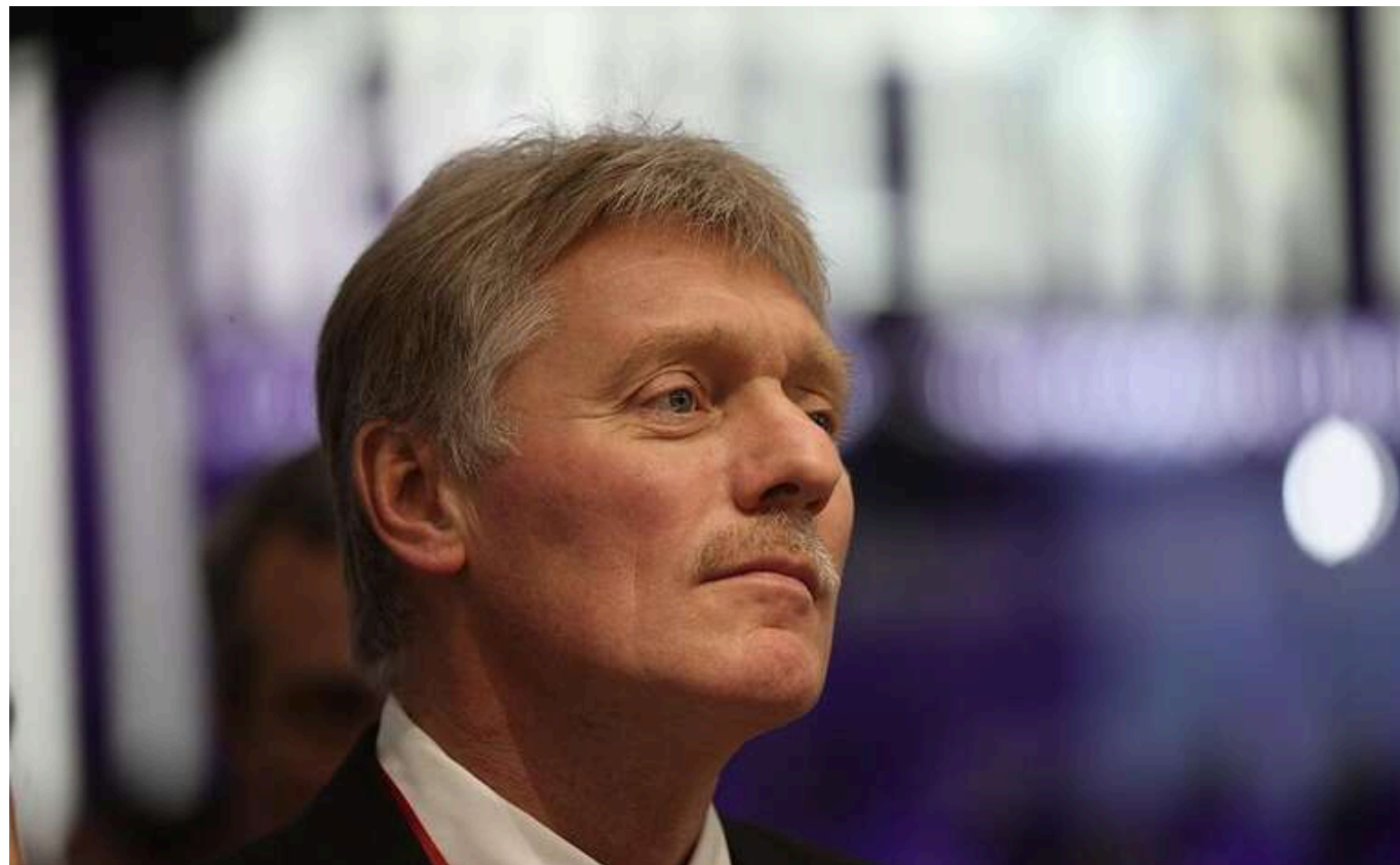
Санду не є президентом Молдови, - Песков

Кремль відмовляється визнавати Майю Санду президентом Молдови за підсумками минулих виборів.