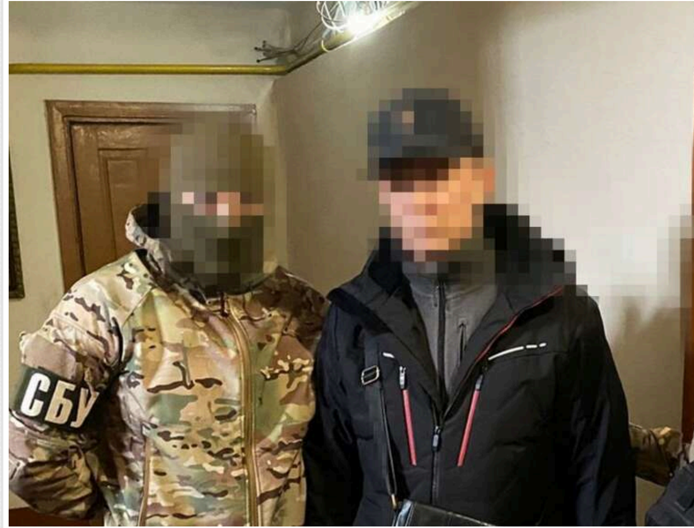
В Україні затримали агентку російського ГРУ та двох колаборантів із Херсона: серед них – окупаційний «віцемер»

Служба Безпеки України затримала ще трьох співників Росії, які співпрацювали з окупантами на Херсонщині. Однією з них стала мешканка обласного центру, агентка військової розвідки РФ, яка коригувала ворожий вогонь по Силам оборони.