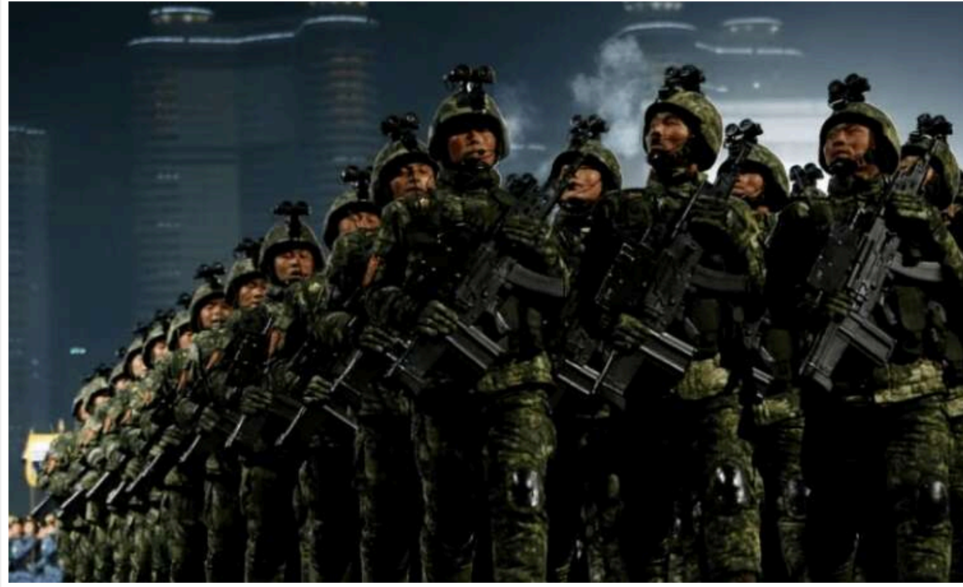
G7 та союзні держави співпрацюють задля узгодженої реакції на залучення Росією військових сил КНДР

Міністри закордонних справ країн "Групи семи" (G7) та трьох ключових союзниць висловили у вівторок, що вони серйозно занепокоєні розгортанням військових сил Північної Кореї в Росії та працюють над спільною відповіддю на цю ситуацію.