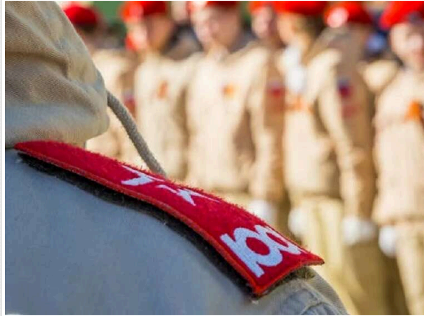
В окупованому Маріуполі загарбники змусили дітей присягнути на вірність РФ

В окупованому Маріуполі учнів Нахімовського училища віком від 12 років змусили присягнути на вірність країні-агресору.