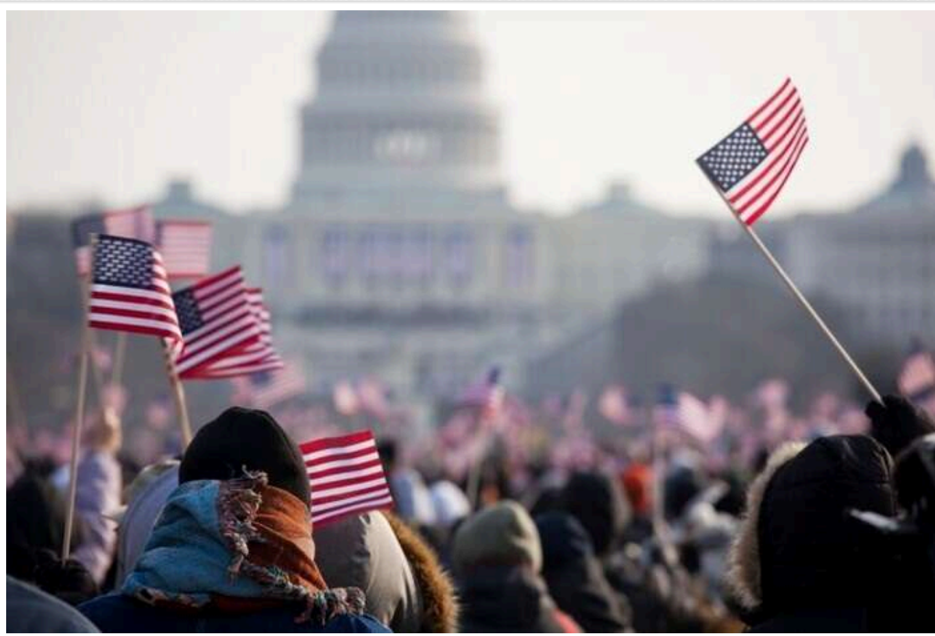
The Economist: Після виборів у США реальний ризик насильства

Ризик насильства після виборів у США є реальним, на думку The Economist.