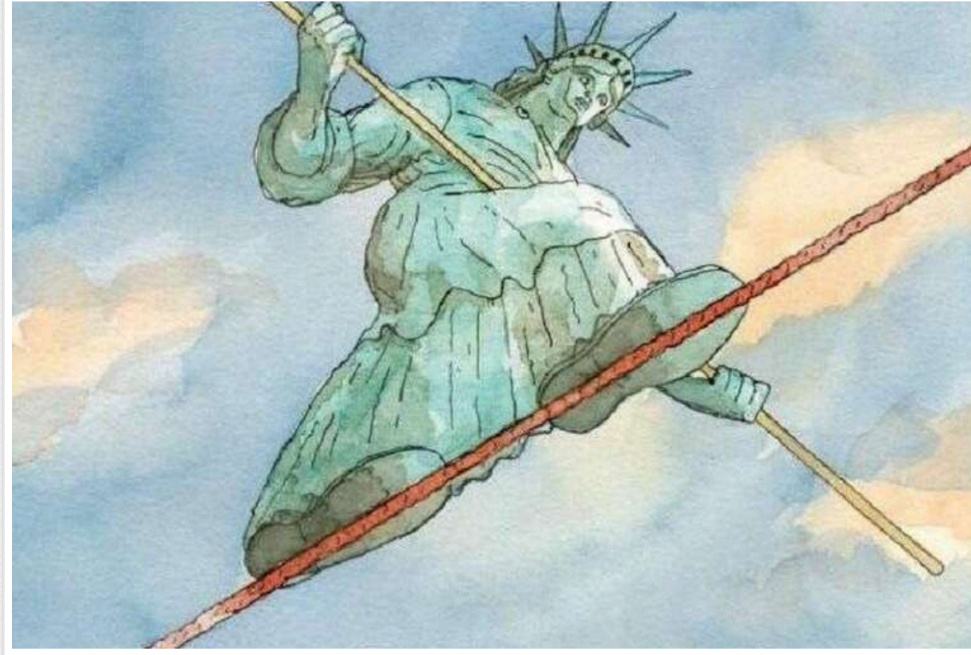
Вибори в США: У The New Yorker представили обкладинку до свого наступного випуску

Видання The New Yorker продемонструвало обкладинку до свого майбутнього випуску, який вийде у понеділок, вже після виборів президента США.