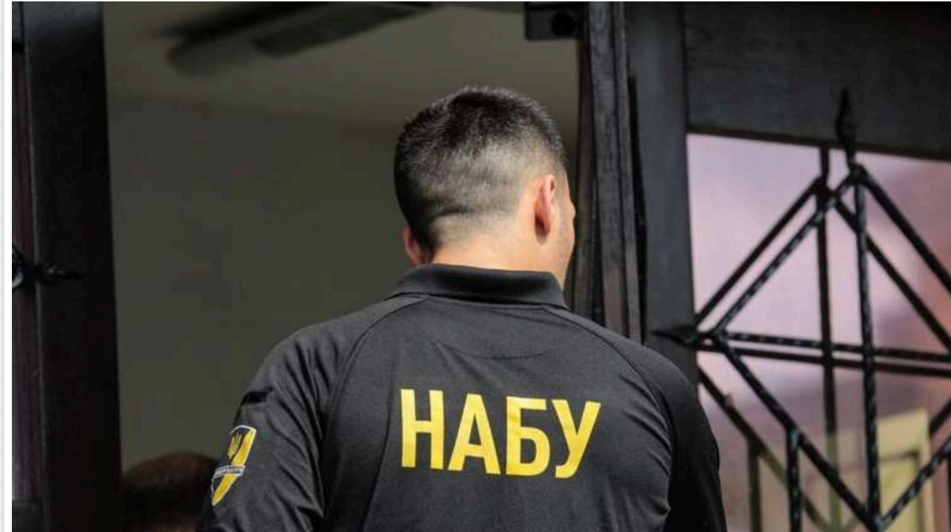
Справу двох депутатів Сумської облради за підкуп голови МВА передано до суду, - НАБУ

Спеціальна антикорупційна прокуратура передала до суду обвинувальний акт стосовно двох депутатів Сумської обласної ради, яких у березні виявили на наданні голові міської військової адміністрації хабаря в розмірі $100 тис.