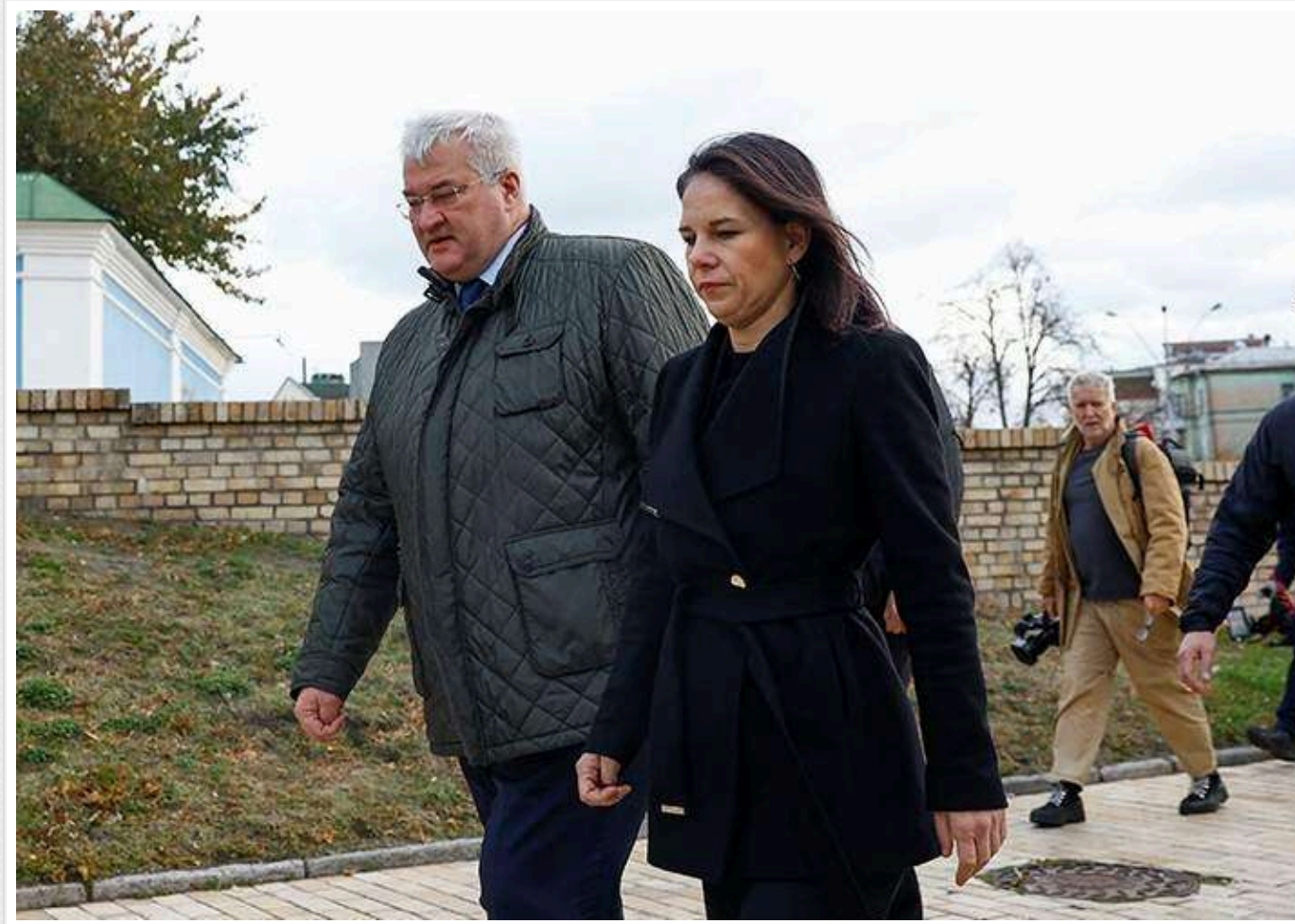
Бербок заявила, що у Німеччині "деколи свідомо" підмінюють роль агресора й жертви

Міністерка закордонних справ Німеччини Анналена Бербок підтвердила, що у ФРН є люди, які "заміщують роль агресора і жертви" у контексті російського повномасштабного вторгнення в Україну. Крім того, дехто в країні дійсно має сумніви стосовно необхідності допомоги Україні.