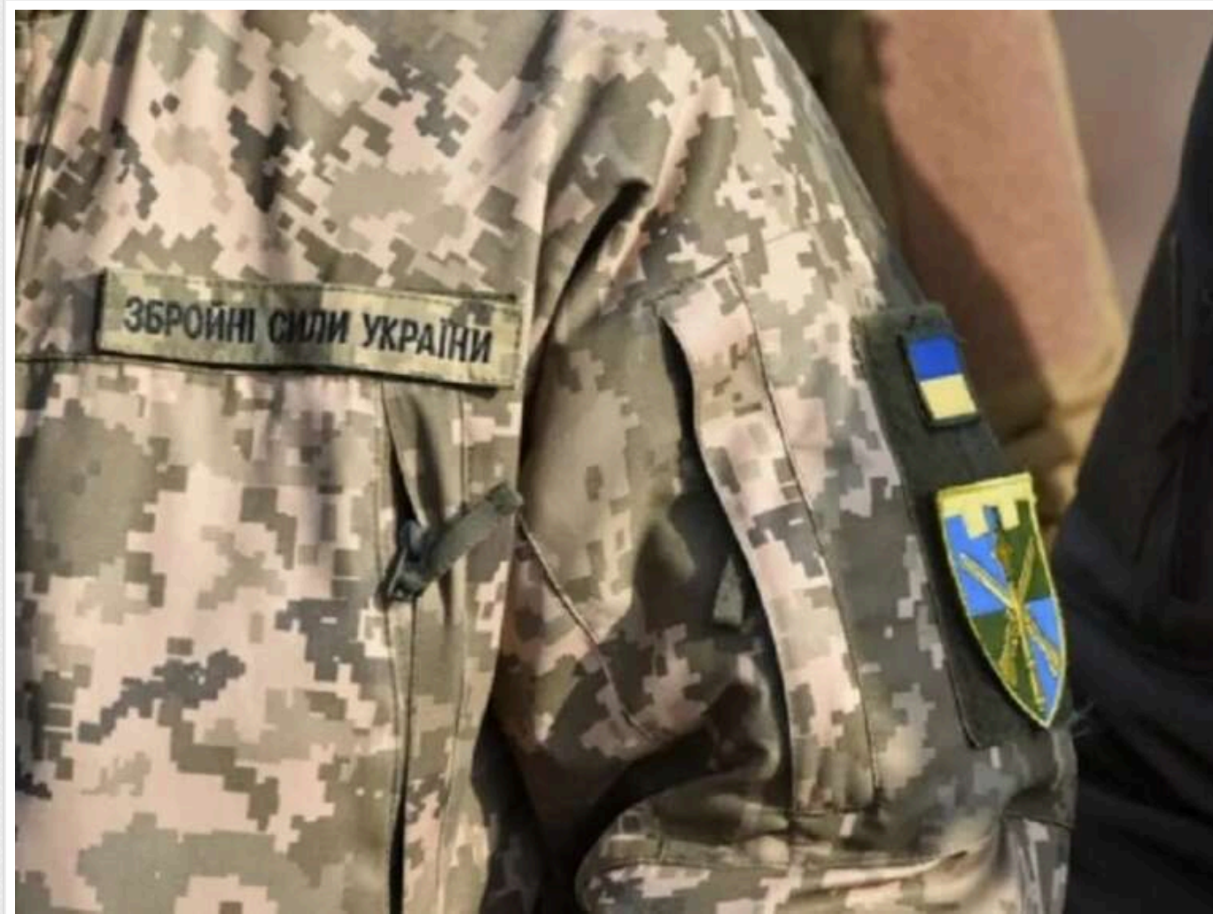
На Дніпропетровщині чоловік погрожував працівникам ТЦК зброєю та запальною сумішшю

У селищі Лихівка Дніпропетровської області чоловік зустрівся з військовими комісарами, озброєний і з запальною сумішшю, погрожуючи їм стріляниною та підпалом автомобіля.