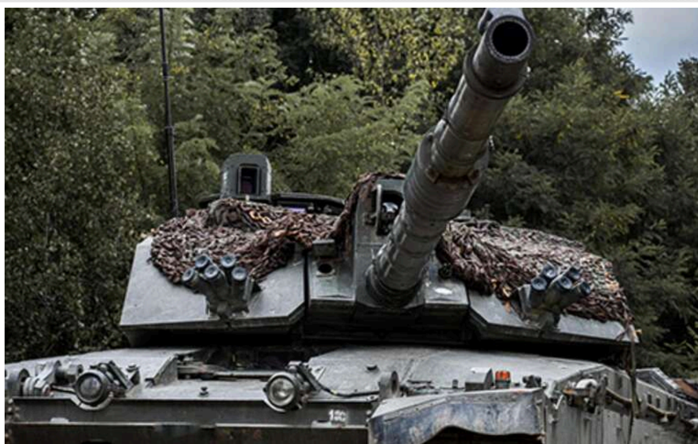
Forbes: ЗСУ ведуть марні бої на Курщині замість Донбасу

Використання найсучаснішої техніки в Курській області РФ змушує замислитися, що саме намагається досягти Київ цією операцією. Тим часом ситуація на Донбасі продовжує поступово погіршуватися.