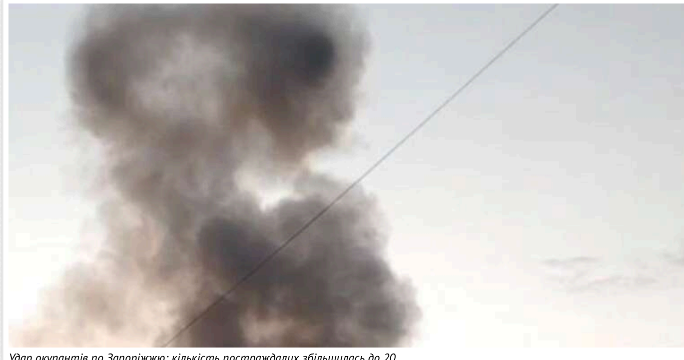
Удар окупантів по Запоріжжю: кількість постраждалих збільшилась до 20

Російські війська продовжують терор цивільного населення України. Вранці 5 листопада вони завдали удар по об'єкту інфраструктури у Запоріжжі.