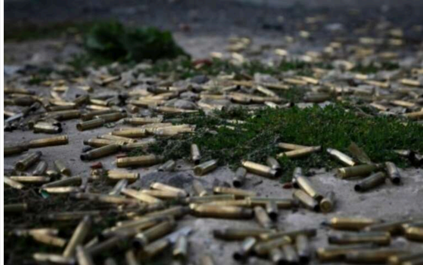
FT: У Курській області сталося перше зіткнення ЗСУ з військовими КНДР

Українська розвідка повідомила, що в Курській області Росії сталося перше бойове зіткнення між українськими військовими та північнокорейськими солдатами.