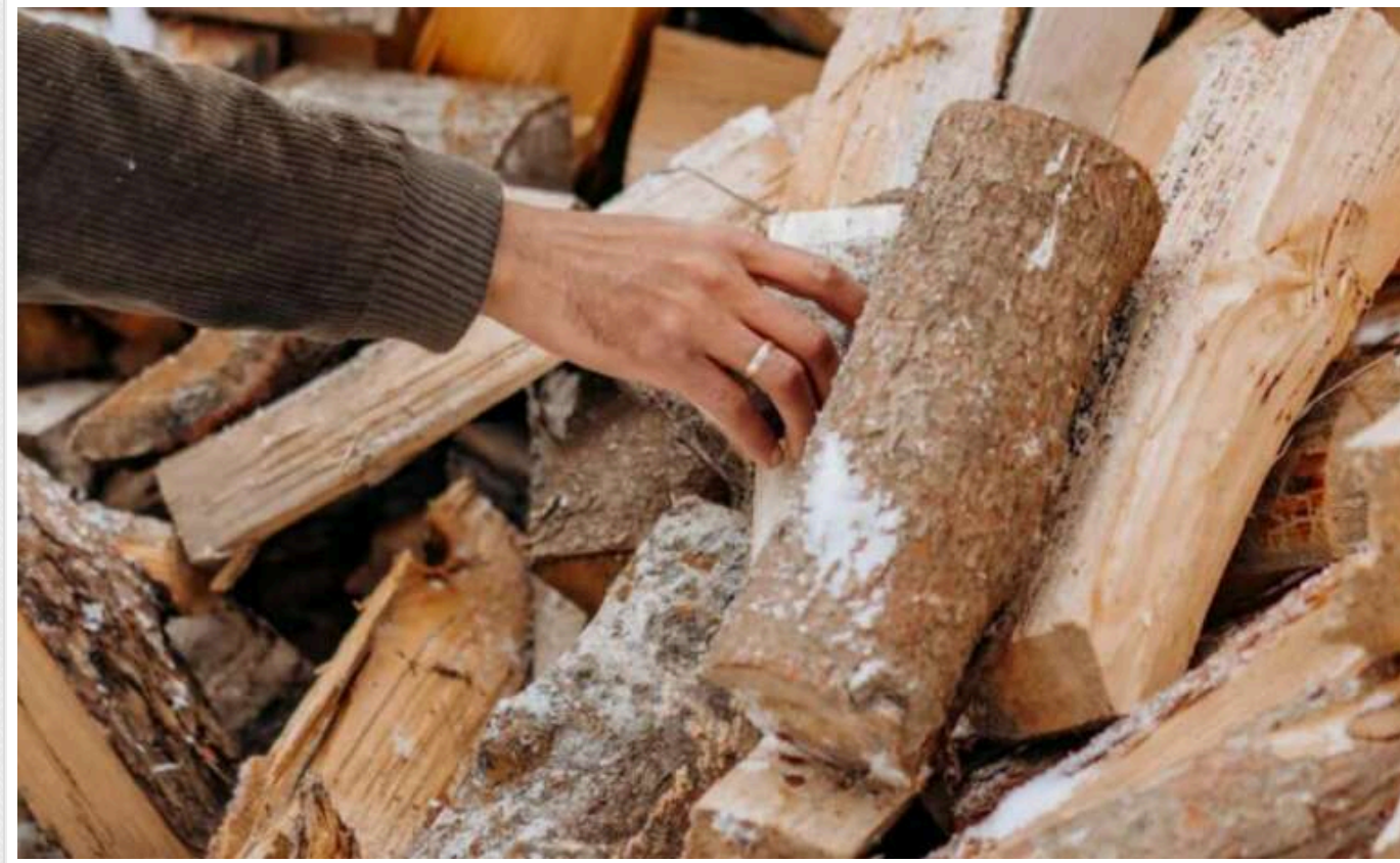
У Раді пояснили, коли людину притягнуть до відповідальності за дрова

На думку народної депутатки Анни Скороход, зараз незаконно проводиться вирубка лісу, який потім реалізують за заниженою ціною без документів. Часто також вирубають дерева "на потреби ЗСУ", проте до військових вони так і не доходять.