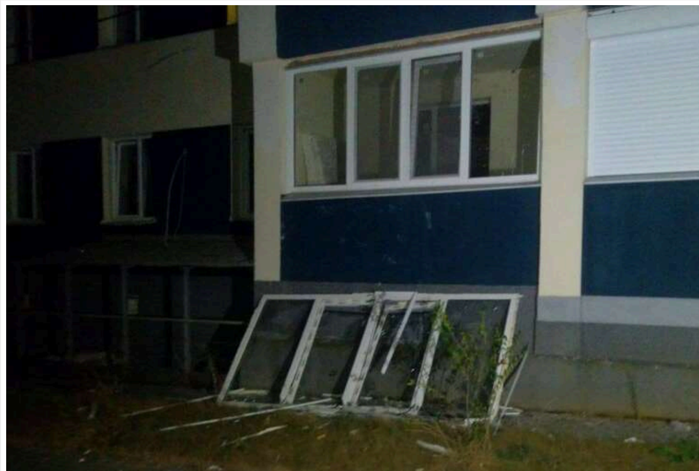
Окупанти завдали 11 ударів по Харківській області: три удари припали на Харків

Голова ХОВА Олег Синегубов повідомив про наслідки обстрілів Харкова та області.