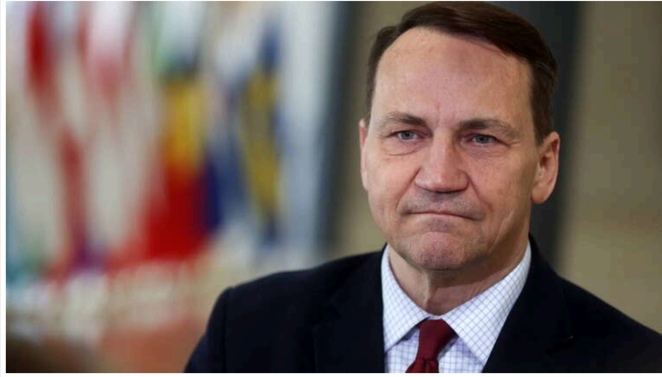
Сікорський заявив, що розчарований відсутністю прогресу в питанні ексгумації жертв Волинської трагедії

Міністр закордонних справ Польщі Радослав Сікорський заявив, що Україна обіцяла прогрес у справі ексгумації жертв Волинської трагедії до листопада, але цього не сталося.