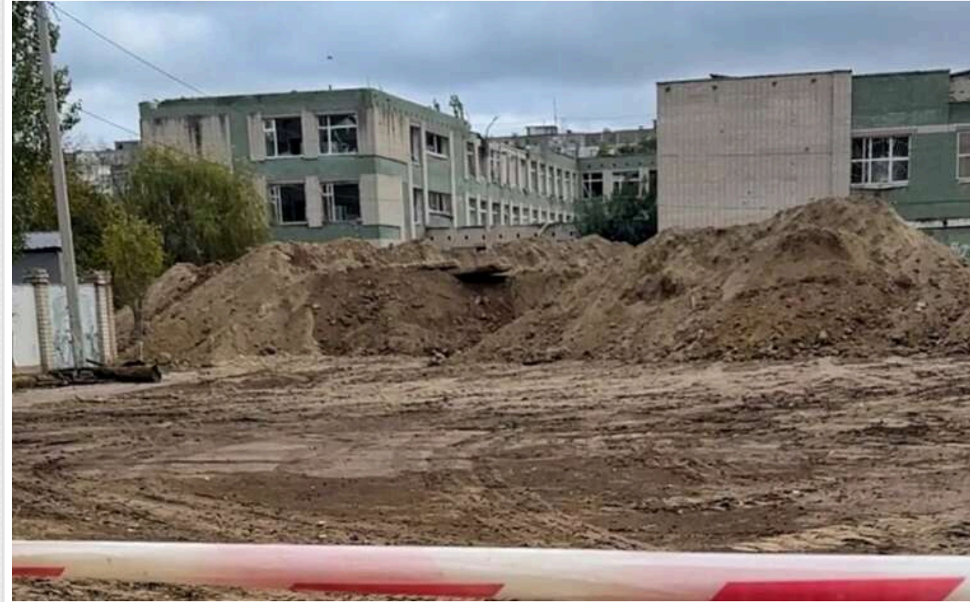
Хто буде та заробляє на підземних школах Херсона, в якому майже не залишилось дітей - розслідування