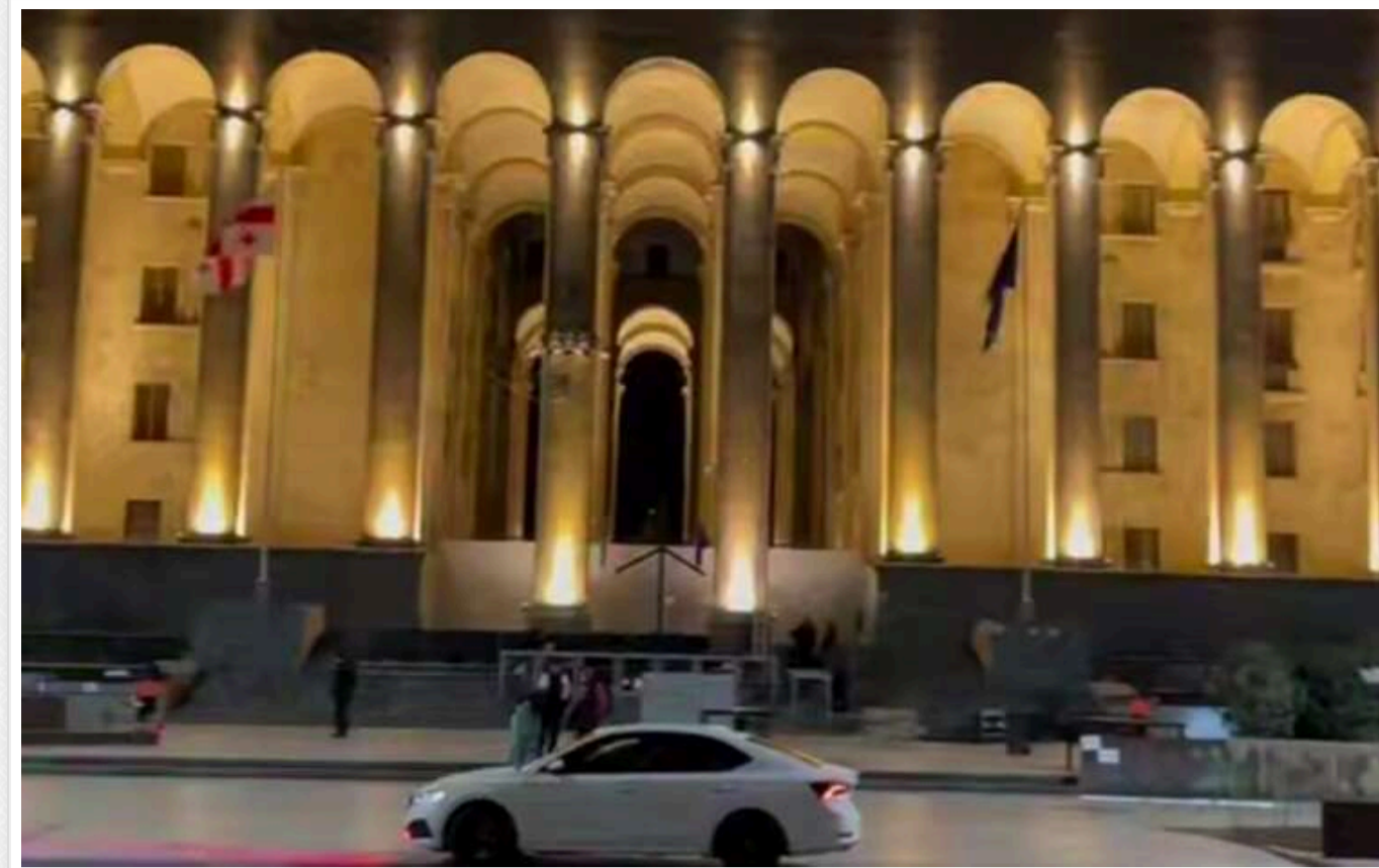
Протести проти результатів виборів біля будівлі парламенту в Тбілісі завершилися без заворушень

У центрі Тбілісі в понеділок відбулась велика акція протесту грузинської опозиції проти результатів парламентських виборів, на яких, за офіційною інформацією ЦВК, перемогу здобула партія «Грузинська мрія».