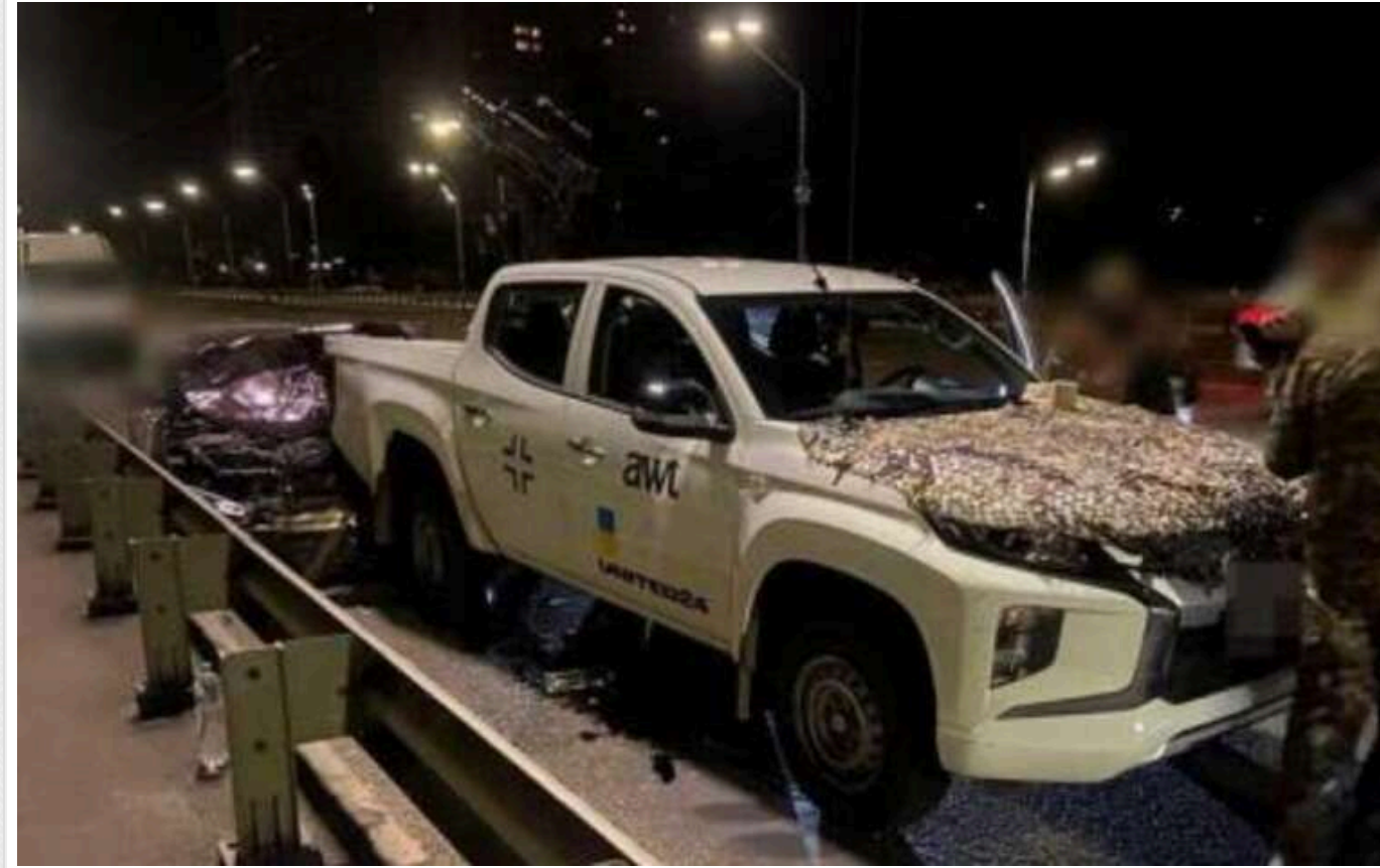
У Києві п'яний порушник комендантської години протаранив автомобіль мобільної ППО