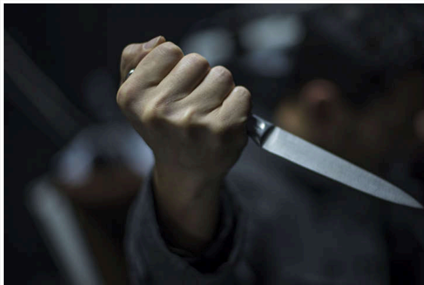
Неадекватний харків'янин напав на своїх знайомих із ножем, стверджуючи, що приятель почав читати його думки без дозволу

Цю інформацію надав начальник слідчого управління поліції регіону Сергій Болвінов.