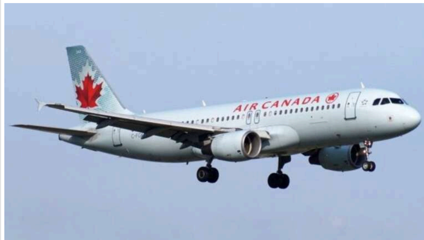
Західні розвідувальні служби запідозрили РФ у підготовці підпалів на літаках, що прямують до США та Канади

На думку західних розвідувальних структур, російська військова розвідка (ГРУ) планувала підпалити літаки, що літають в Північну Америку.