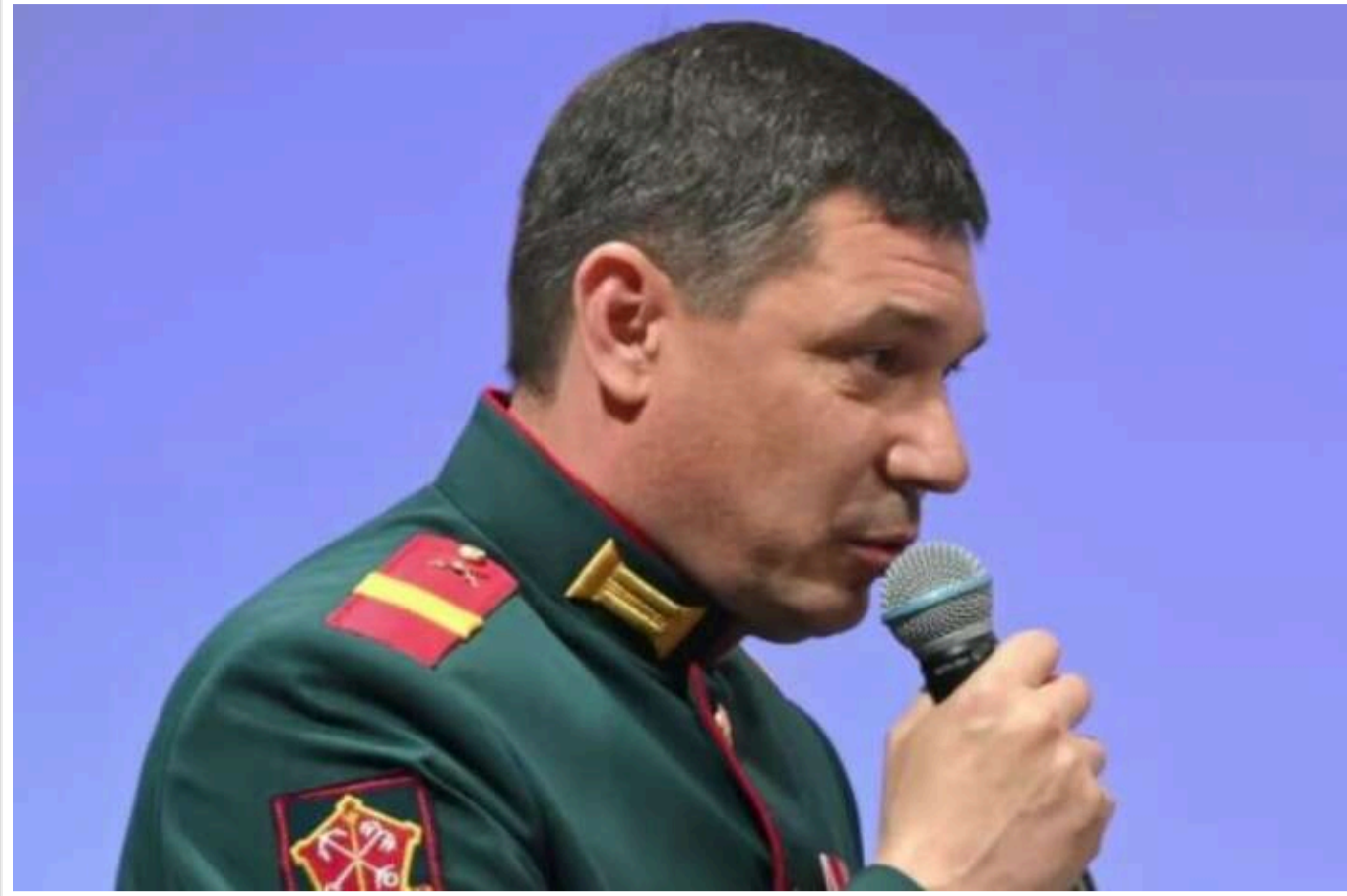
Путін призначив учасника війни в Україні керувати цілою областю

Керівник Кремля Володимир Путін призначив Євгена Первишова, який нібито брав участь у військових діях в Україні, тимчасовим виконувачем обов'язків голови Тамбовської області.