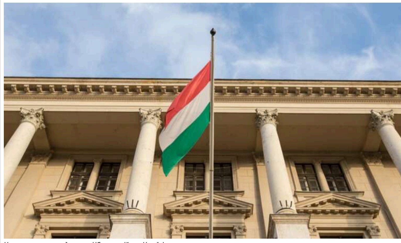
Угорщина знову продовжила НС через війну в Україні

Парламент Угорщини у понеділок, 4 листопада, продовжив на шість місяців режим надзвичайного стану, який надає прем'єр-міністру Віктору Орбану широкі повноваження керувати країною.