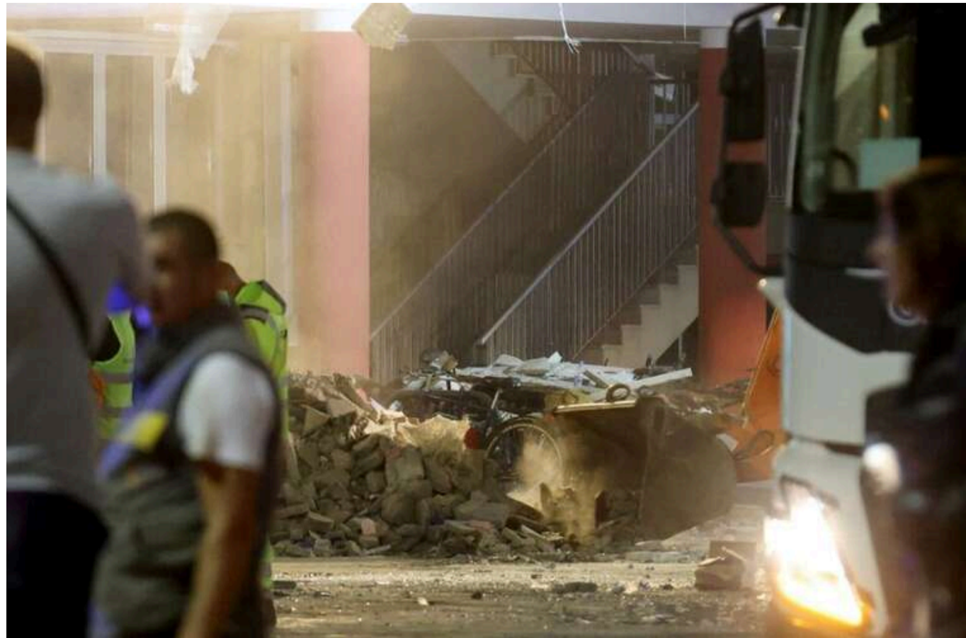
У Сербії міністр подає у відставку через трагічний обвал на залізничній станції

Міністр будівництва, транспорту та інфраструктури Сербії Горан Вешіч заявив, що подасть у відставку після аварії на залізничному вокзалі в місті Новий Сад, внаслідок якої загинули 14 людей і троє зазнали серйозних поранень.