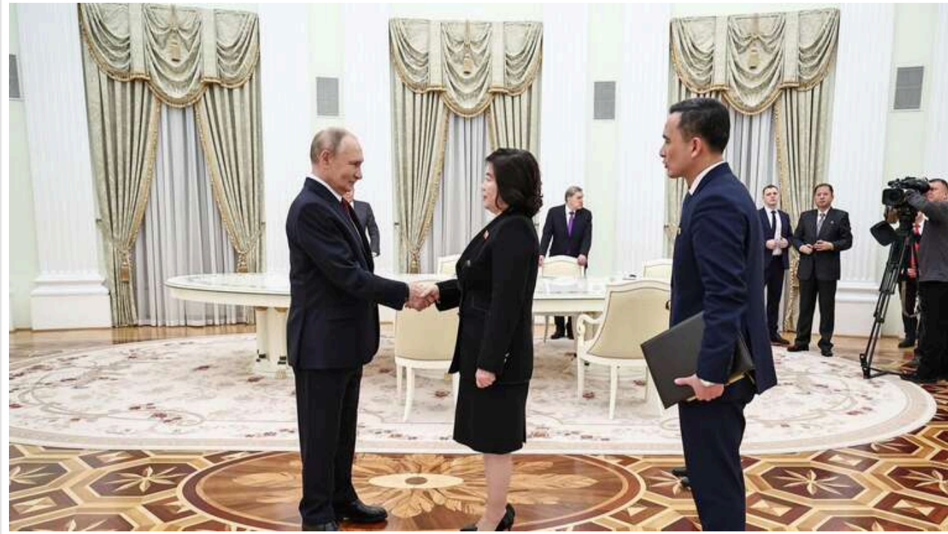
Путін зустрівся з главою МЗС КНДР, яка запевнила, що КНДР буде «рішуче підтримувати російських товаришів»

Президент РФ прийняв у Кремлі міністра закордонних справ Північної Кореї Цой Сон Хі.