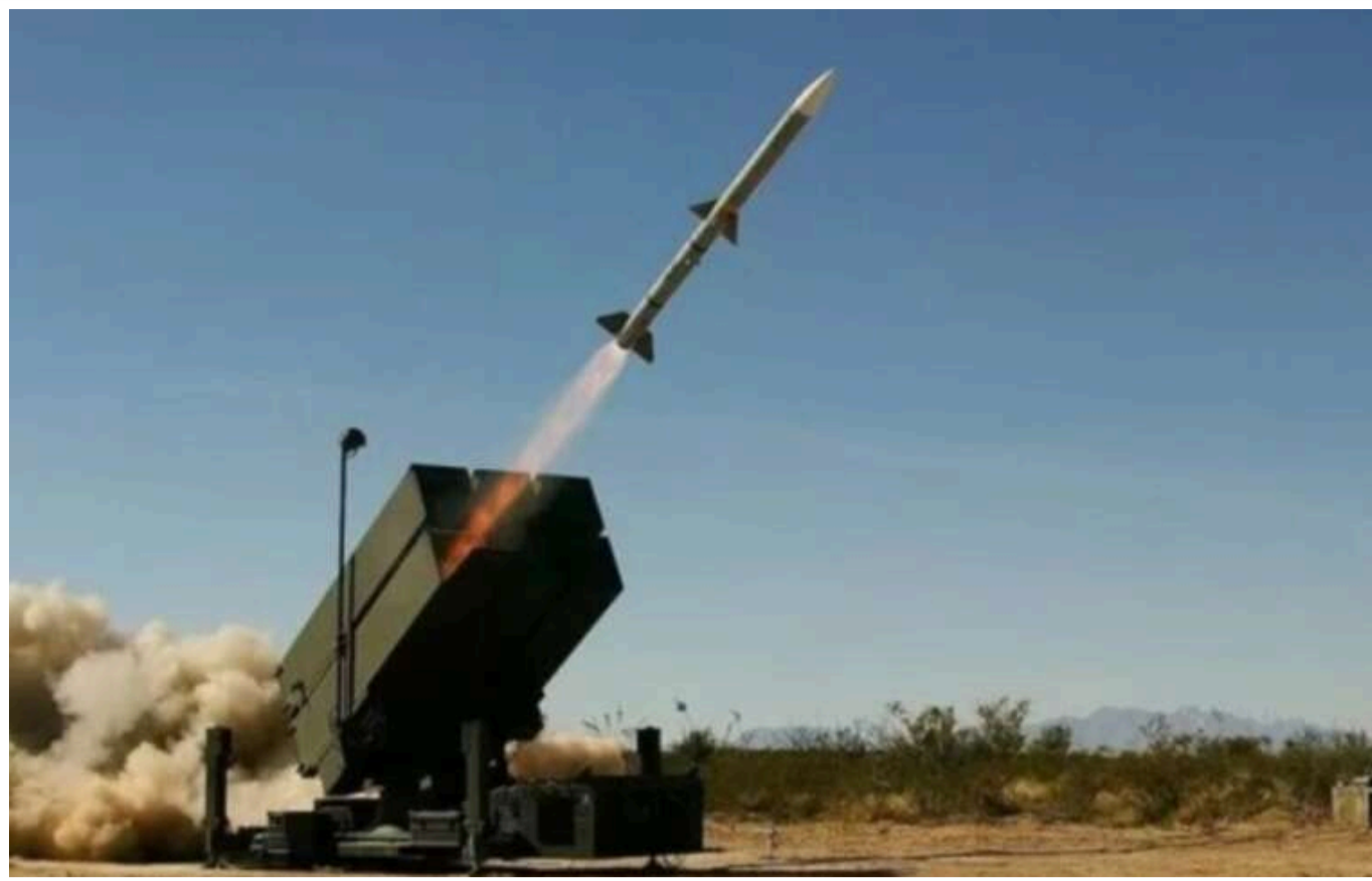
Зеленський: Канада надіслала Україні систему ППО NASAMS

Президент Володимир Зеленський обговорив із прем'єр-міністром Канади Джастіном Трюдо подальшу співпрацю стосовно організації другого Саміту миру та питання оборонної підтримки.