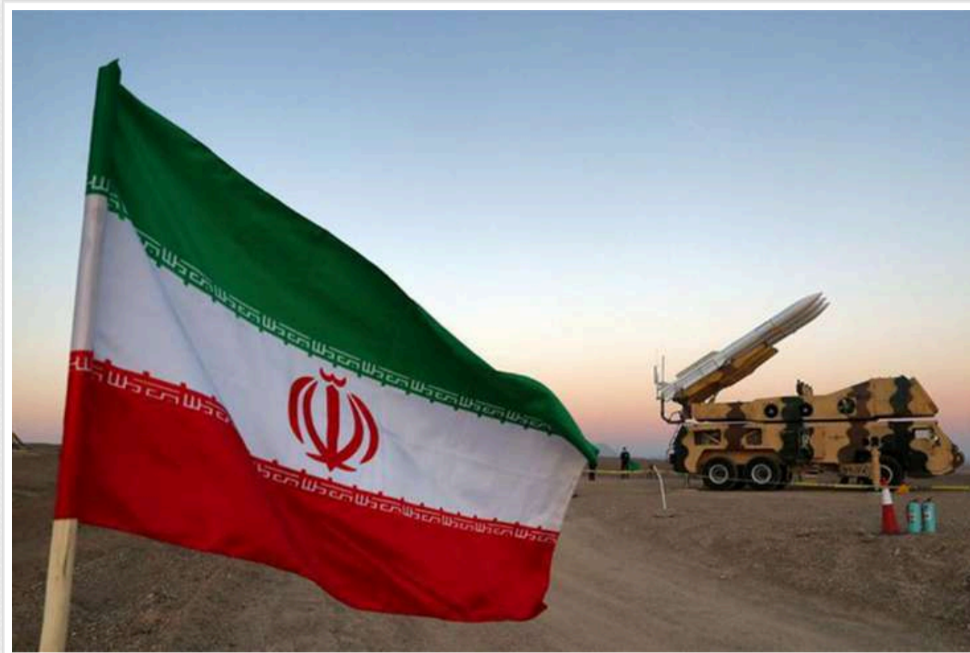
WSJ: Іран планує завдати по Ізраїлю масштабного удару з використанням ще більш потужних боєголовок та іншого озброєння

Про це повідомляє The Wall Street Journal з посиланням на джерела.