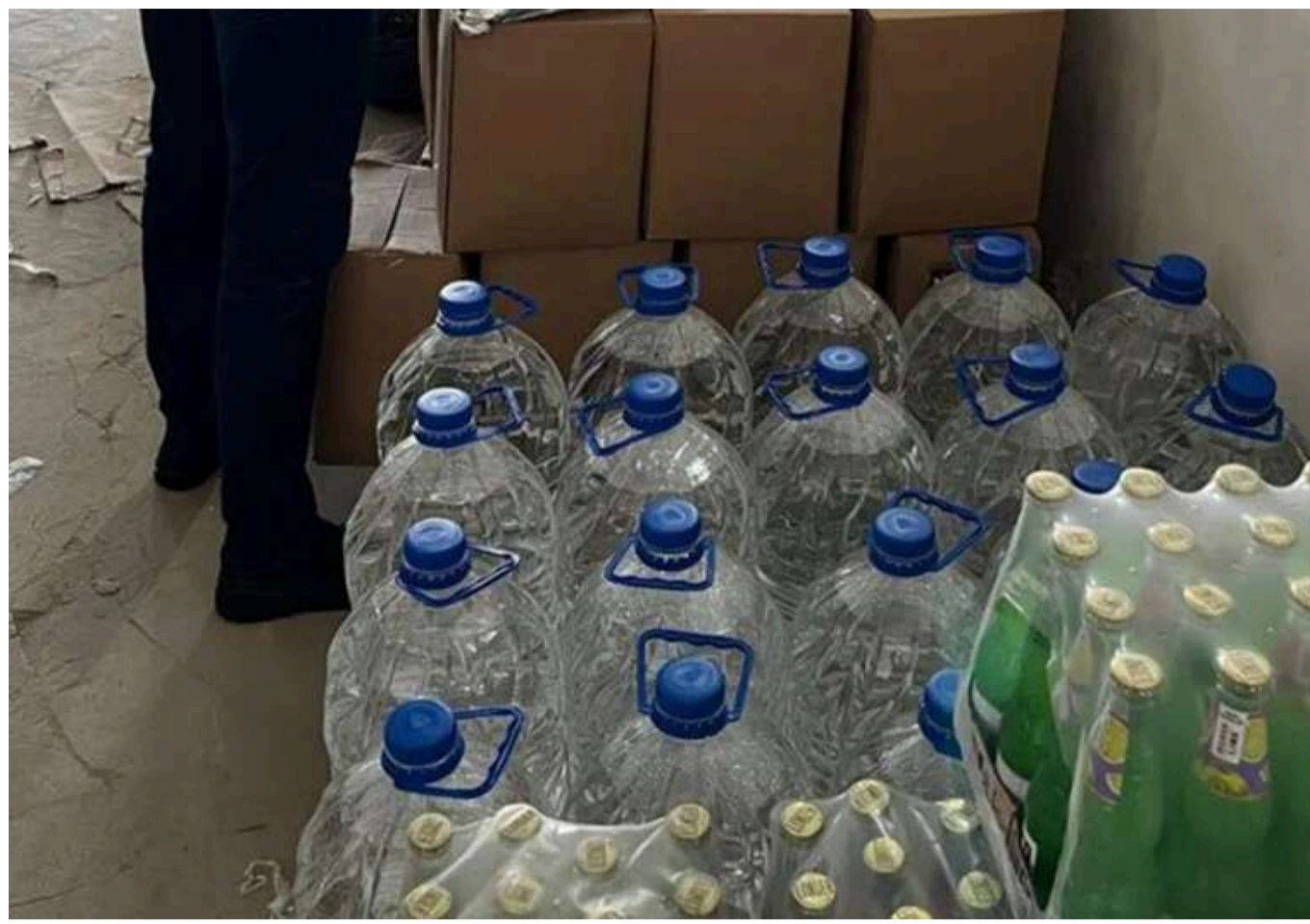
У Вінниці українців "травили" паленою горілкою, - БЕБ

У Вінниці судитимуть власника нелегального виробництва алкогольної продукції – зокрема, горілки. Йому, серед іншого, загрожує ув'язнення на строк від 3 до 5 років.