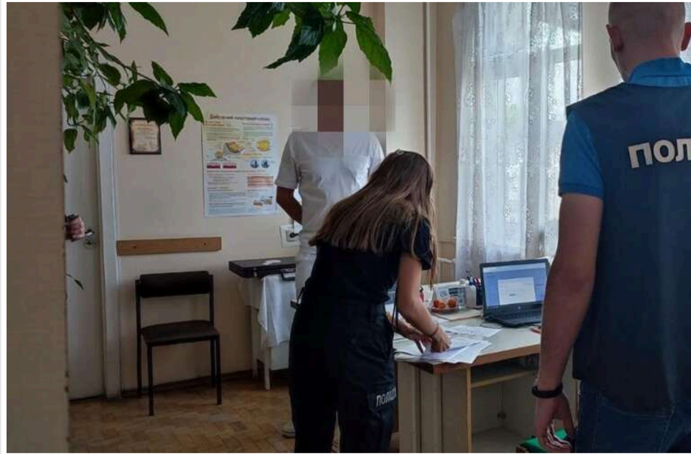
У Тернопільській області офтальмологів судитимуть за масові каліцтва пацієнтів: 18 людей осліпли через лікарські помилки

У Тернопільській області судитимуть трьох лікарів та завідувача офтальмологічного відділення районної лікарні, оскільки їхні дії призвели до того, що 18 пацієнтів частково або повністю втратили зір. Про це повідомляє пресслужба Генеральної прокуратури.