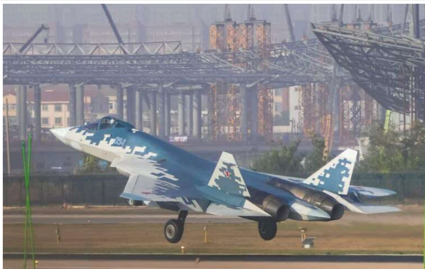
Російський Су-57 прилетів у Китай

Хоча Росія просуває Су-57 як літак п'ятого покоління, китайські спеціалісти до недавнього часу не включали його в цей список, виділяючи тільки власний J-20 та американські F-22 і F-35.