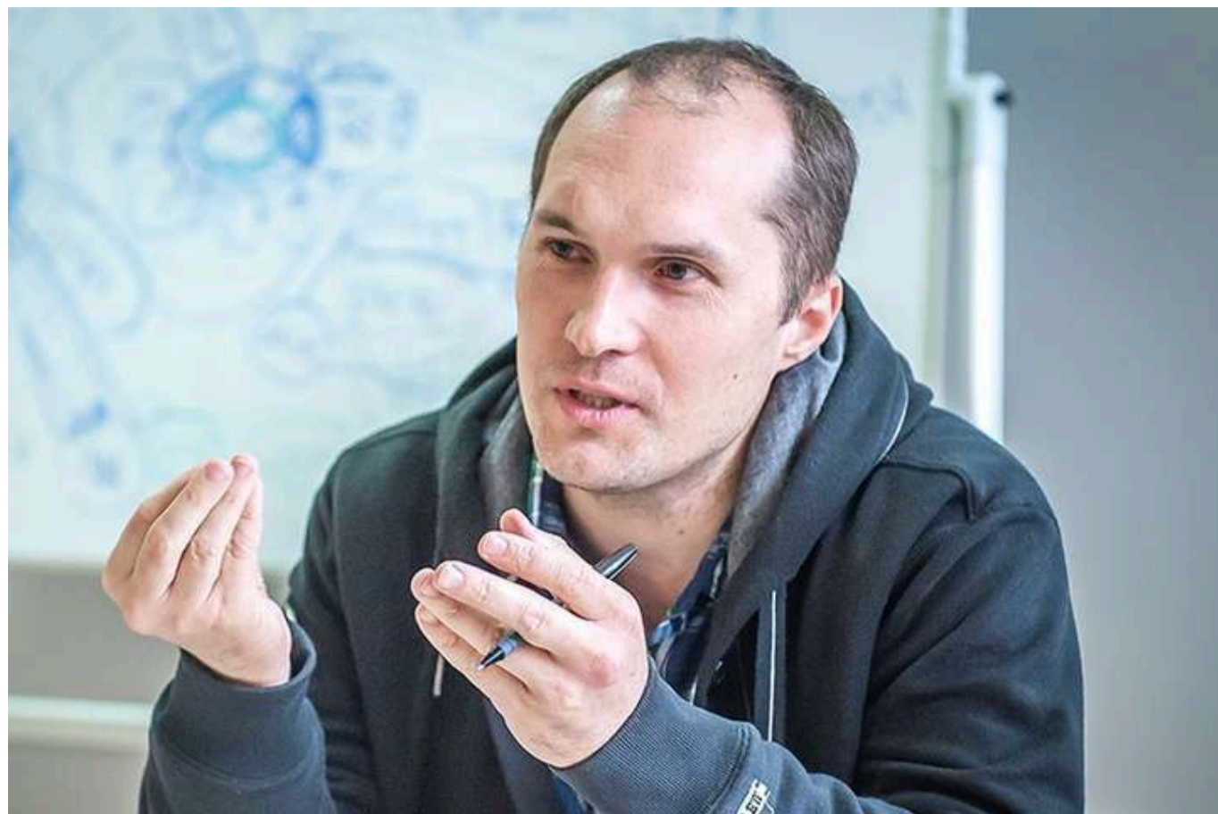
Журналіст розповів, чому Іван Баканов має сидіти в тюрмі за державну зраду та співпрацю з ФСБ РФ

ЗМІ з'ясували, що Іван Баканов подарував сину статус військовослужбовця СБУ та безтурботне щасливе життя в ресторанах та спортзалах Києва під час війни.