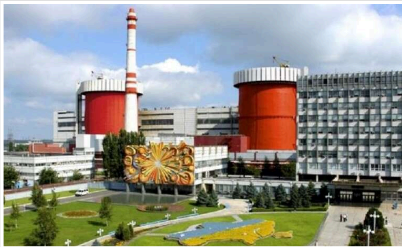
Прокуратура не змогла анулювати угоду восьмирічної давнини щодо постачання датчиків для АЕС

Прокуратура не змогла в суді анулювати угоду між НАЕК "Енергоатом" та ТОВ "ТД Вимірювальна Техніка" щодо постачання для АЕС датчиків тиску, а також не стягнула з приватної компанії більше 400 тис. грн.