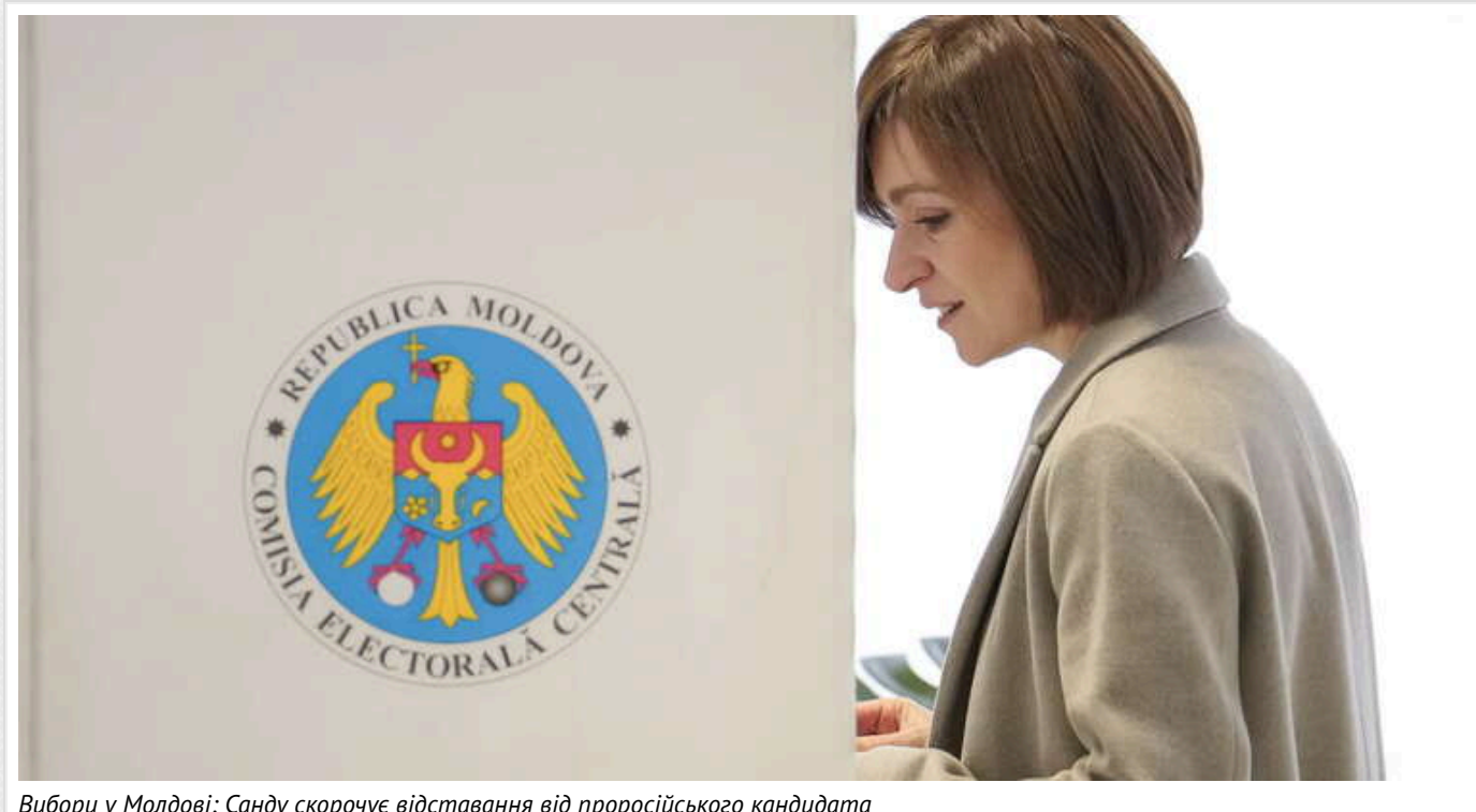
Вибори у Молдові: Санду скорочує відставання від проросійського кандидата