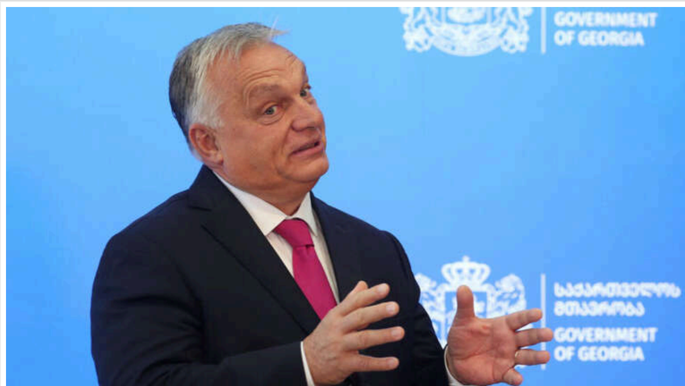
У разі перемоги Трампа Європа не зможе бути "за війну", - Орбан

Прем'єр-міністр Угорщини Віктор Орбан переконаний, що у разі перемоги Дональда Трампа на виборах у США Європа не зможе продовжувати свій "провоєнний курс" – тобто надавати військову допомогу Україні для її захисту від Росії.