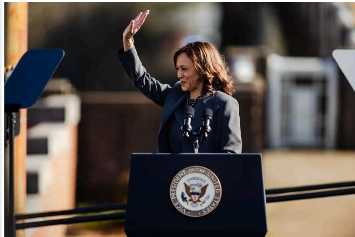
Вибори в США: Гарріс випереджає Трампа в несподіваному штаті

Кандидатка від Демократичної партії Камала Гарріс випереджає Дональда Трампа в новому опитуванні серед ймовірних виборців у штаті Айова, де раніше республіканець мав значну перевагу на виборах 2016 та 2020 років.